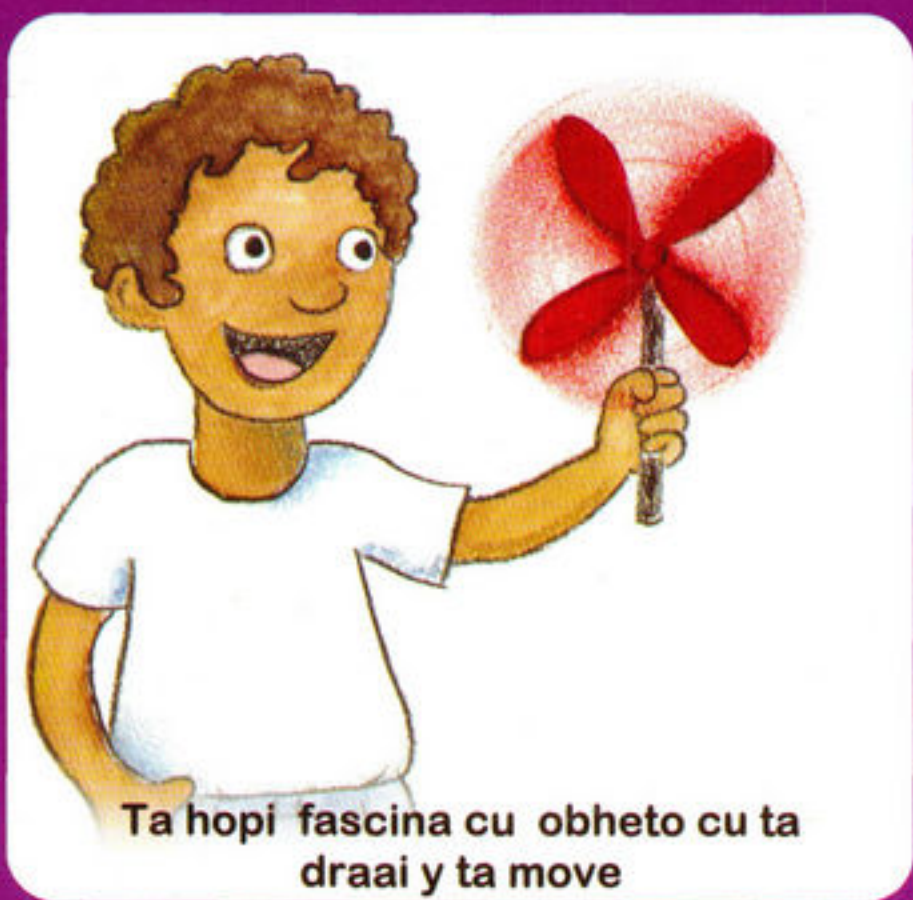
Ta hopi fascina cu obheto cu ta draai y ta move

Algun caracteristicanan riparabel di conducta.